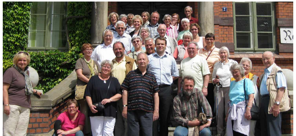
»» Großes Gruppenbild vor dem Plauer Rathaus

Neben vielen langgedienten Genossinnen und Genossen nahmen auch einige neue Mitglieder und viele Freunde und Bekannte am Ausflug teil.